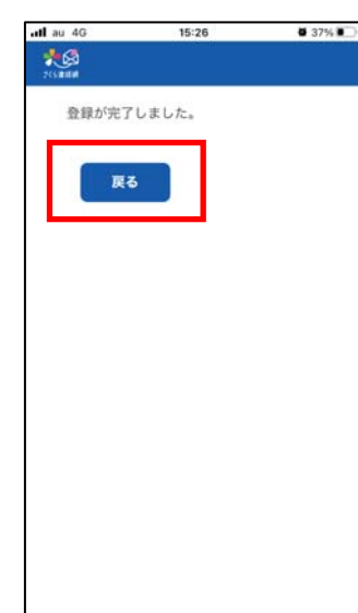
⑥「登録が完了」=送信完了