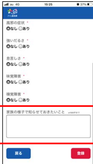
④知らせたいことは文章を入力