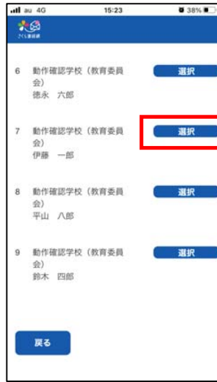
②該当のお子様を選択