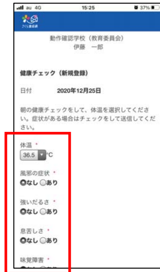
③「体温」や「項目」を選択