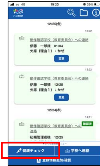
①「健康チェック」をタップ